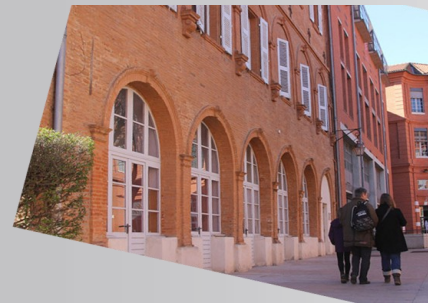
LYCEE OZENNE TOULOUSE